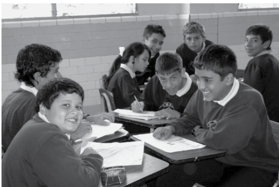
Figura 1. Alumnos de primer año, sección A, dibujando las caricaturas