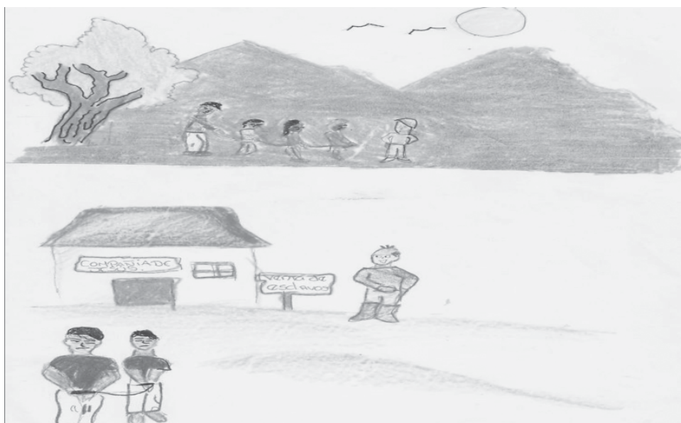
Figura 9. Ruth Rivas, Traslado de esclavos fugados desde un cumbe y venta de esclavos (2009)