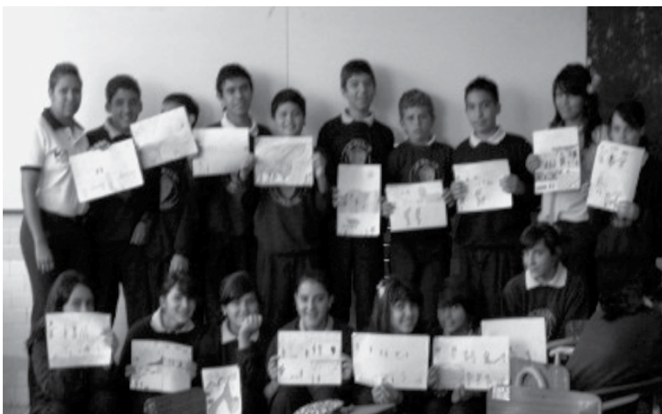
Figura 11. Exposiciones de los alumnos de primer año, sección A