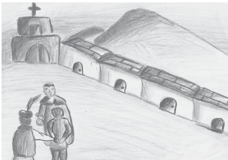
Figura 5. Imanole Padilla, Evangelización a los esclavos africanos y descendientes (2009)