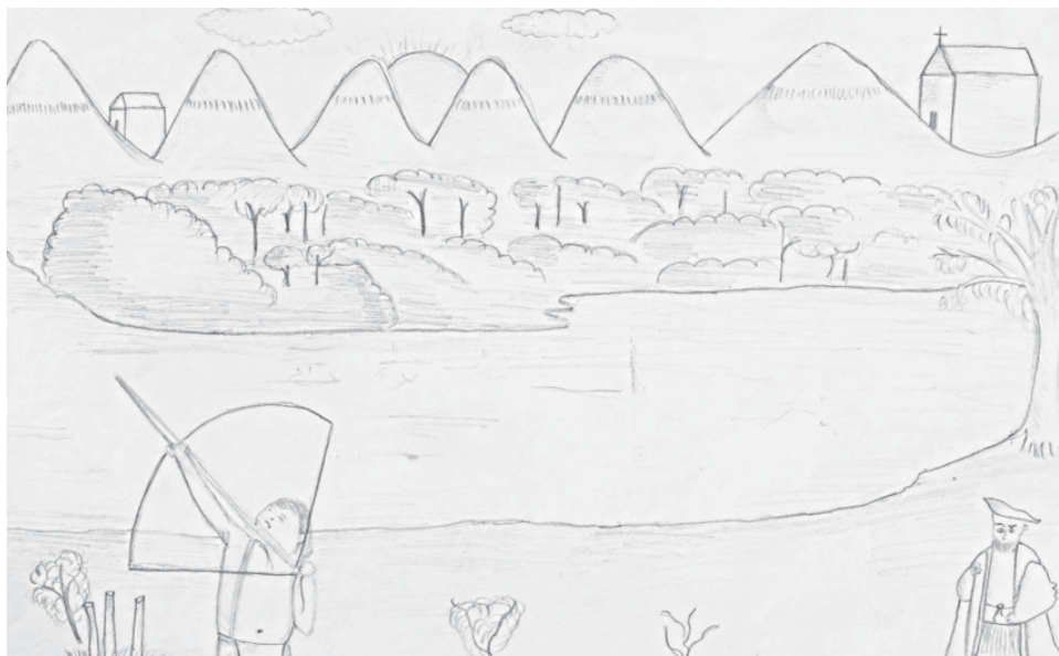
Figura 8. José Guillén, Transculturación de los esclavos africanos con costumbres indígenas (2009)