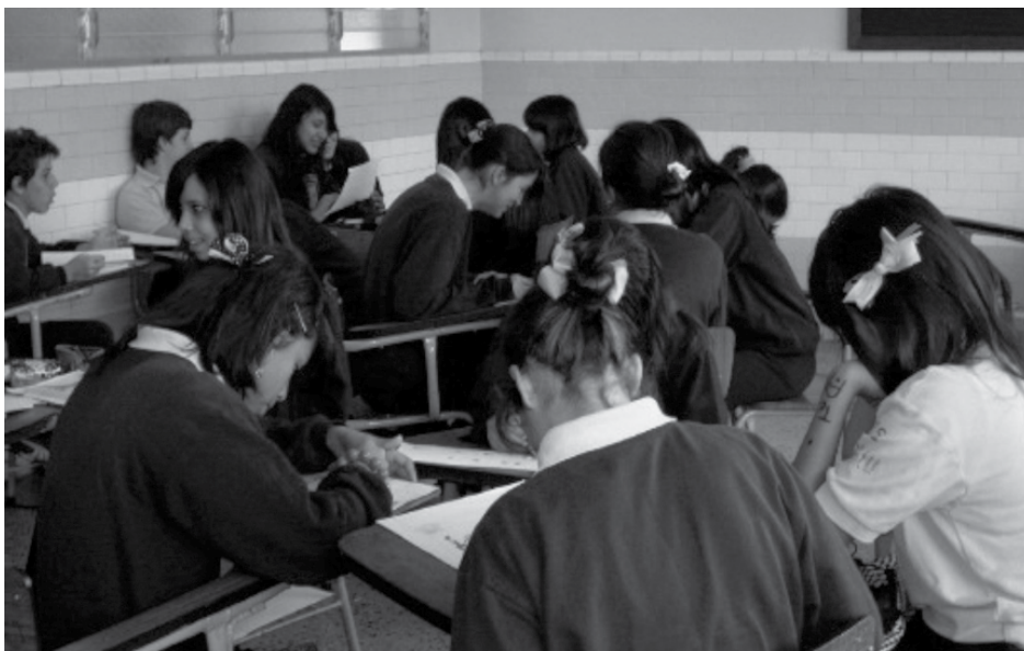
Figura 2. Alumnos de primer año, sección A, dibujando las caricaturas