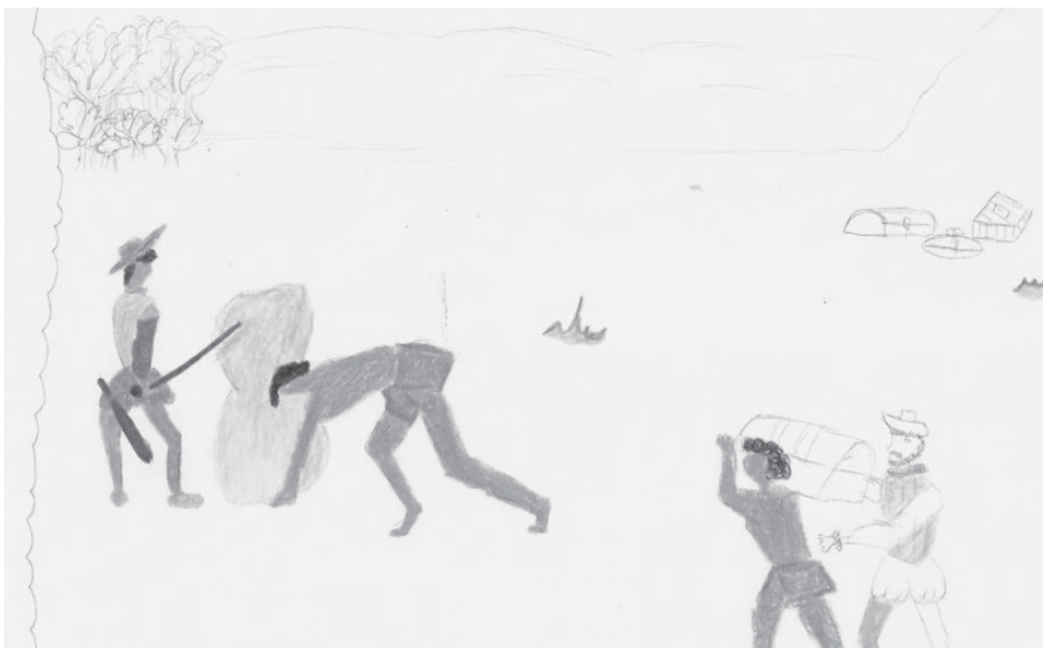
Figura 6. María Loaiza, Explotación laboral a los esclavos africanos (2009)