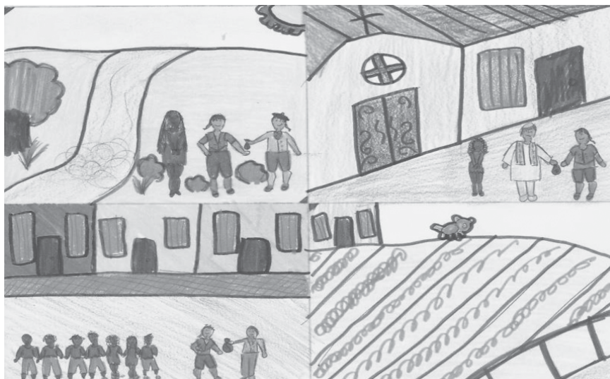
Figura 4. María Pacheco, Penetración esclava en la ciudad de Mérida y compra de esclavos por parte de la orden de los Jesuitas (2009)