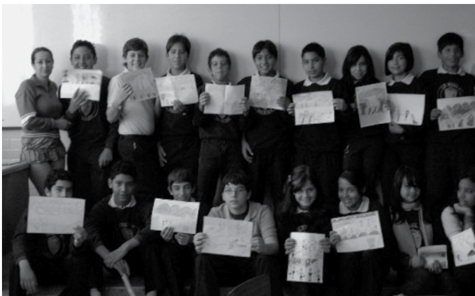
Figura 10. Exposiciones de los alumnos de primer año, sección A